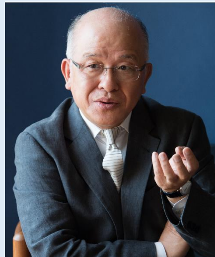
浅田 次郎プロフィール

1951年 東京生まれ 1995年 『地下鉄に乗って』(徳間書店)で第16回吉川英治文学新人賞を受賞 1997年 『鉄道員』(集英社)で第117回直木賞を受賞 2000年 『壬生義士伝』(文藝春秋)で第13回柴田錬三郎賞を受賞 2006年 『お腹召しませ』(中央公論新社)で第1回中央公論文芸賞、および第10回司馬遼太郎賞を受賞 2008年 『中原の虹』(講談社)で第42回吉川英治文学賞を受賞 2010年 『終わらざる夏』(集英社)で第64回毎日出版文化賞を受賞 2017年 『帰郷』(集英社)で第43回大佛次郎賞を受賞 著書 『プリズンホテル』シリーズ 『天切り松 闇がたり』シリーズ 『蒼穹の昂』 『中原の虹』 『霞町物語』 『憑神』 『天国までの百マイル』 『椿山課長の七日間』 『五郎治殿御始末』 『一刀斎夢録』 『獅子吼』 『赤猫異聞』 『一路』 『黒書院の六兵衛』 『長く高い壁』 他多数あり 近著 『おもかげ』(毎日新聞出版) 『天子蒙塵 第四巻』(講談社)